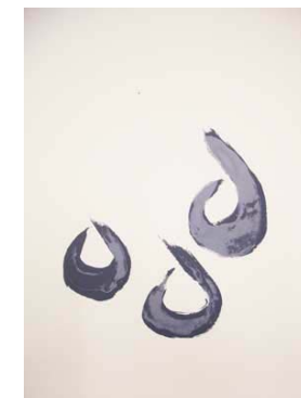
Buns #1 Cybil Chiu 2009

Tutors: Simon Lau, Yung Sau-mui Date: 14 Aug – 9 Oct 2010 (No class on 21 Aug) Time: 11:00 – 14:00 Tuition: $1,470.00 (plus $700 Material Fee) Meetings: 8, a total of 24 contact hours Workshop Outline A further study on colors separation, registration, photographic serigraphy and the investigation on transparent and opaque ink.