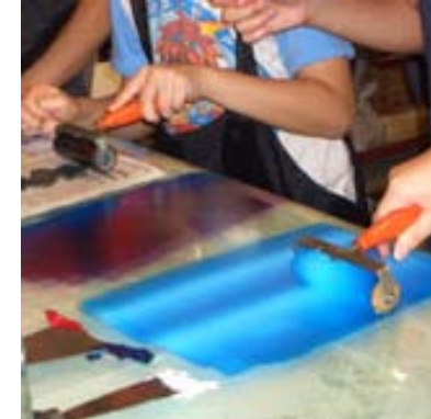
Inking the plates, children from Home Services, TWHG

Together We Stride, a community art project targeting at providing art workshops for the young & the aged. The project aims at sharing the joy of creating, and, at the same time helping the deprived ones to build up confidence so that they would be more connected to the community.