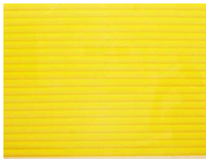
Yellow 劉家成 2009

導師: 劉家成 翁秀梅 日期: 2010年8月14日至10月9日 (逢星期六)(8月21日無課) 時間: 11:00 – 14:00 節數: 共8節, 共24小時 費用: $1,470.00 (另$700物料費) 課程內容: 課程為孔版畫工作坊工作坊的延續, 探討分色、攝影製版、套色疊印、透明油、凸漿的應用等。