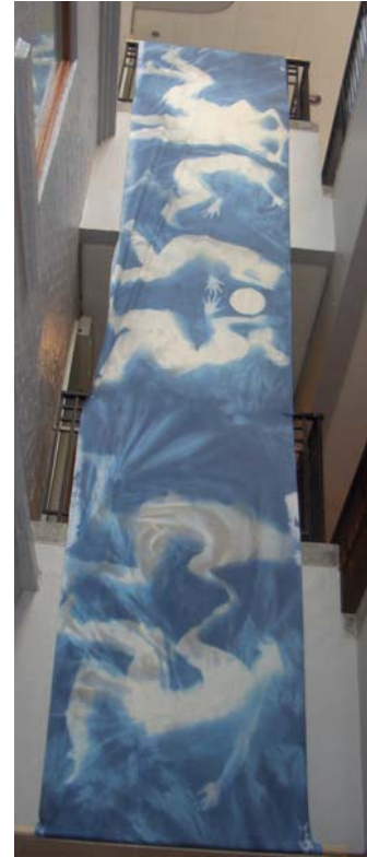
齊齊曬太陽－藍印工作坊作品 展出於香港視覺藝術中心

當我參與荃灣大會堂的《跨界越界》展覽的掛畫工作時才知道掛畫有分「畫心」及應如何決定畫的高度。更想不到掛畫及貼作品標題竟要一整天才能完成！