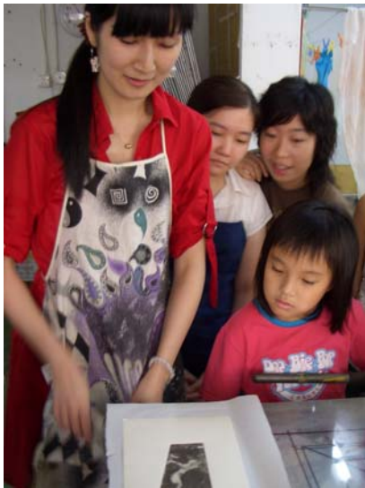
香港版畫工作室駐留計劃 2005

為推廣版畫圖像藝術、鼓勵版畫創作，香港版畫工作室舉辦為期 18 個月的駐留計劃 2008，由 2008 年 4 月至 2009 年 7 月止。計劃為有意進一步探索圖像藝術的朋友而設，旨在提供創作空間，創造一個創作及交流的環境；提供技術支援，鼓勵版畫創作；推廣版畫創作活動，提高創作水平。