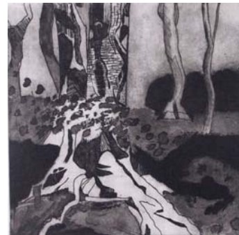
Yoshino, 1745 劉穎樺

導師：張中柱 日期：2008 年 2 月 25 日起逢星期一 時間：7:00 –9:00PM 節數：共 8 節 費用：* $980.00 (另$400 物料費)